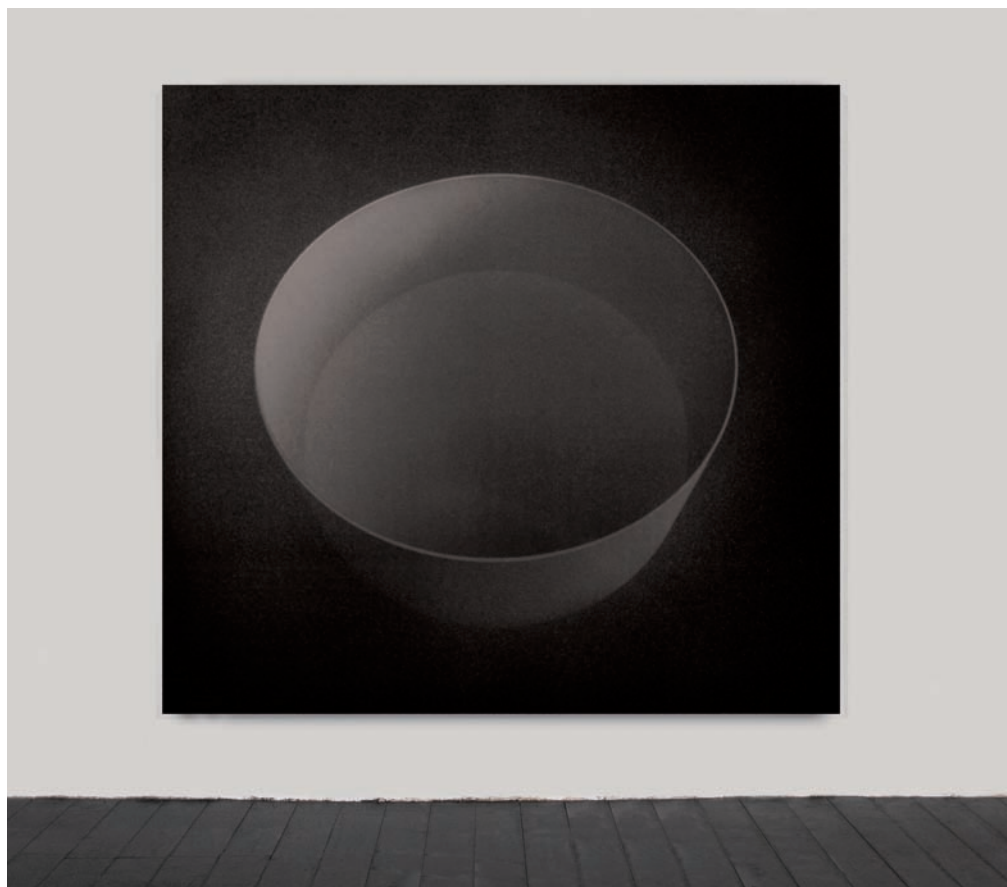
3. Marco Tirelli, veduta dell'installazione permanente alla Fattoria di Celle, Collezione Giuliano Gori, Pistoia. Foto Ottavio Celestino; 4. Marco Tirelli, Senza titolo, 2010, acrilico e inchiostro su tela. Courtesy Galleria Oredaria, Roma. Foto Mario Di Paolo; 5. Marco Tirelli, veduta dell'installazione alla Galleria Oredaria, Roma, 2010. Foto Mario Di Paolo

Artempo ed Infinitum ); l'antico e l'attuale, ad esempio, si annullano in un non tempo "classico". Questo è anche lo spirito che governa il mio lavoro. Tra me e questo Museo è stato un matrimonio inevitabile.