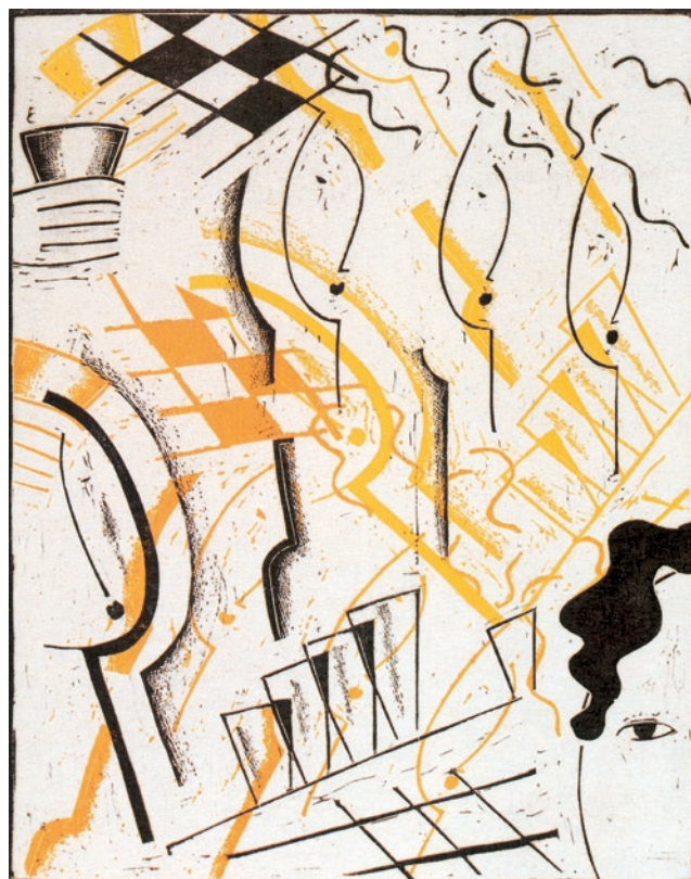
Il bar, 1932, xilografia 1/6, cm 30,2x 24,1

L'opera nasce da doti naturali, ma soprattutto da appassionati studi per la conoscenza dei fenomeni visivi e dalla sintesi tra ragione e im-