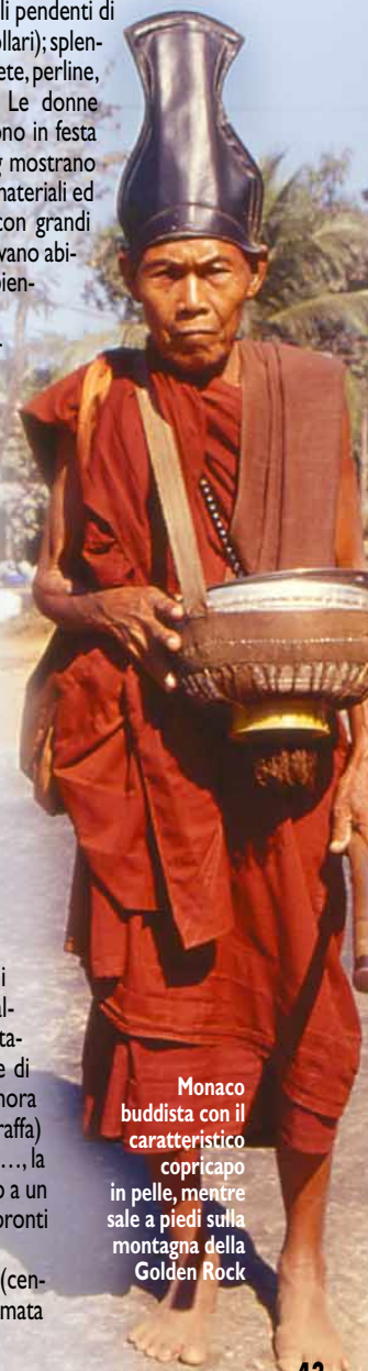
Monaco buddista con il caratteristico copricapo in pelle, mentre sale a piedi sulla montagna della Golden Rock

Dal lago arriviamo a Pindaya (centro dell'etnia Taung-yo ), rinomata