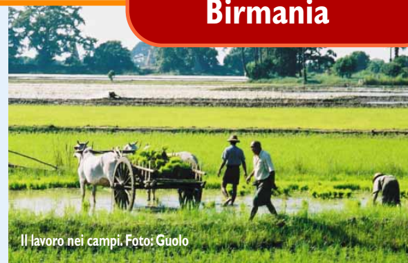
Il lavoro nei campi.

Si parte con l'aereo ad elica della "Yangon Airways", schivando la "Myanma Air" che detiene il record di incidenti. Dopo tre rapidi stop, eccoci a Kyaingtong (aperta al turismo dal 1993), nello Stato Shan, roccaforte del governo